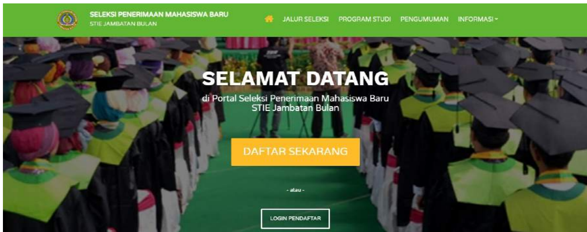
Gambar 2. Halaman Utama Pendaftaran Online

b. Klik Daftar Sekarang, pilih jalur pendaftaran dan tekan tombol Lanjut.