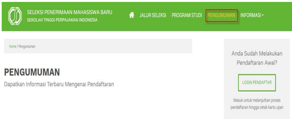
Gambar 20. Halaman Pengumuman