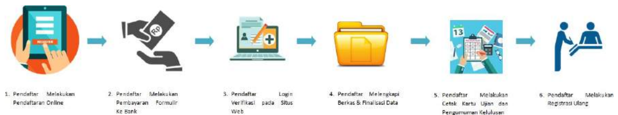
Gambar 1. Skema Penerimaan Mahasiswa Baru

Proses penerimaan mahasiswa baru yang dilakukan oleh pendaftar mulai dari daftar online pada situs web SiAkad Cloud hingga proses daftar ulang. Pada buku ini akan menjelaskan seluruh proses yang dilakukan oleh pendaftar. Berikut skema yang harus dilakukan oleh pendaftar, dan untuk menjelaskan masing-masing tahapan akan dijelaskan pada sub bab selanjutnya.