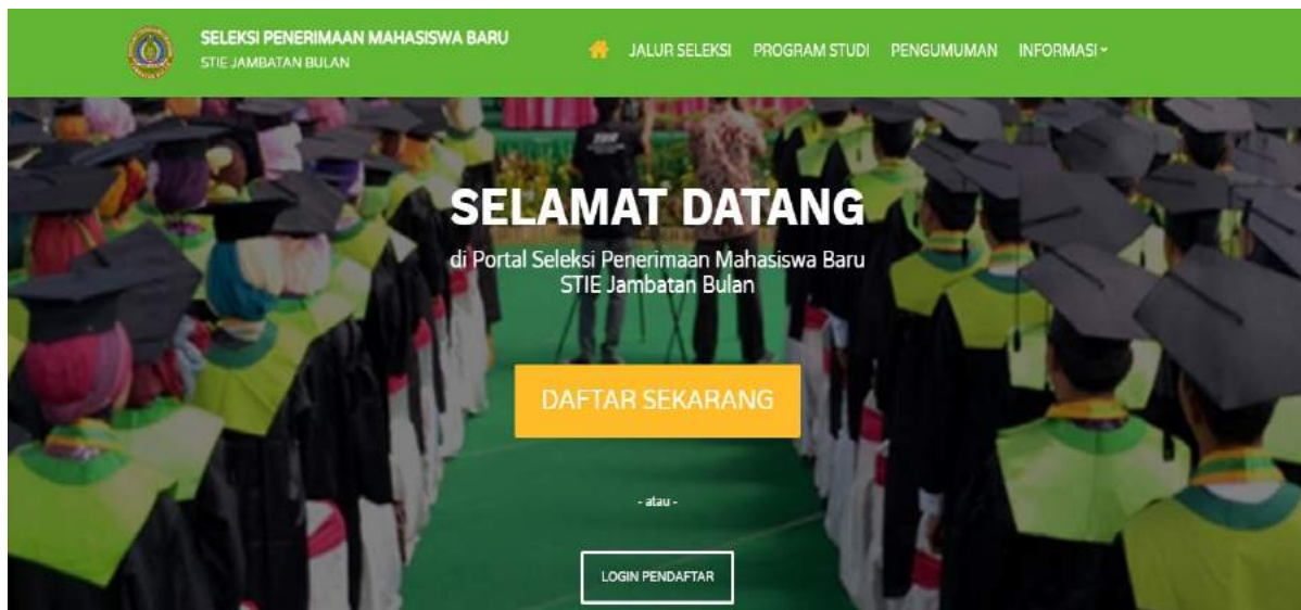
Gambar 7. Halaman Menu Awal Tombol Login Verifikasi