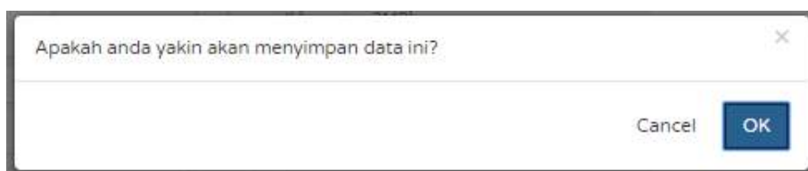
Gambar 16. Konfirmasi Simpan Data